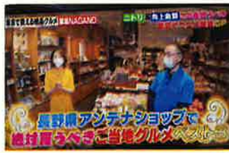
テレビ東京 ソレダメ!～あなたの常識は、非常識～ 2022.3.30 アンテナショップの絶対買うべきBEST3のテーマで、「ジャム」「はちみつ」「おやき」「牛乳パン」「ジンギスカン」等々沢山の商品を紹介。長野県だけで約40分の放送時間となった。