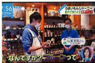
日本テレビ ZIPI 2021.9.22～23 「五平餅」、「サバタケ」、「プルーン」、「紅玉りんごバター」を紹介。合わせてショップ紹介も。