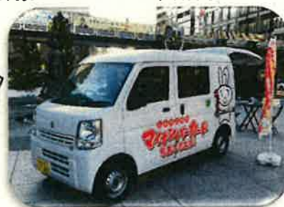
*長野駅前でのPR活動