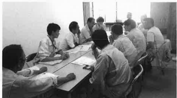
○広島県職員、尾道市職員と打合せ